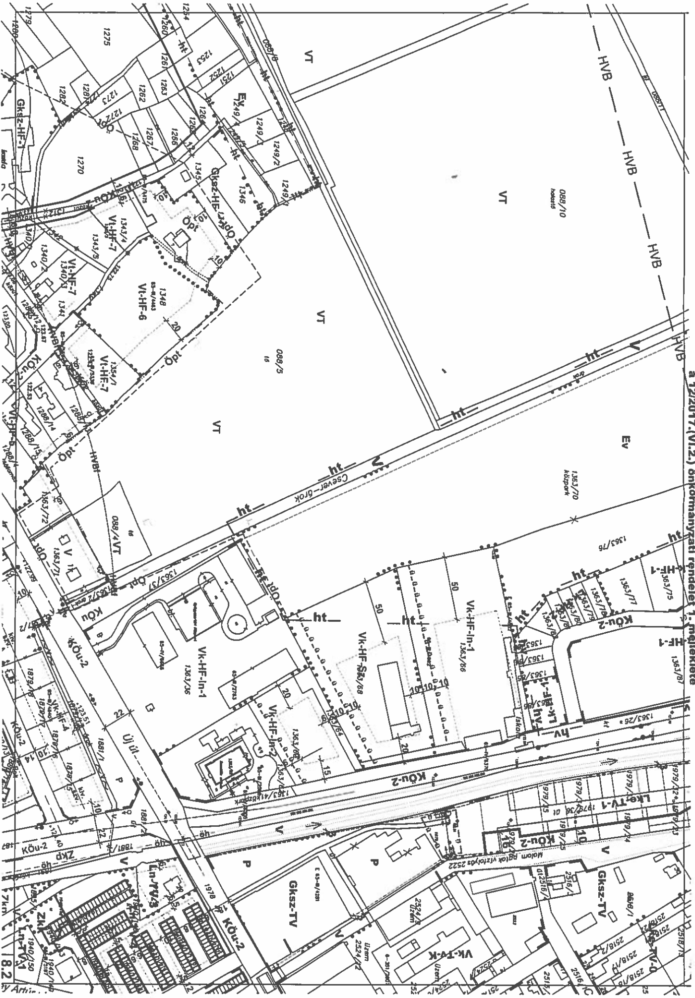
a 12/2017.(VI.2) önkormányzati rendelet 1. melléklete