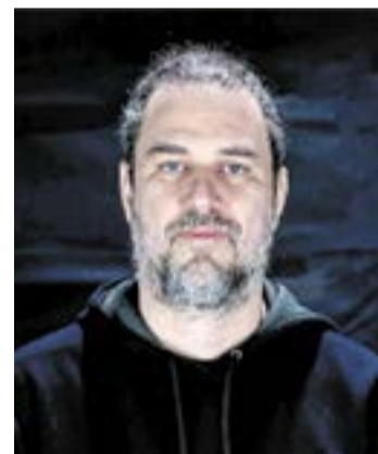
Peron Music Alapítvány (Magyar Zeneművészet)

Hivatása teljes megélésében mindvégig a gyermekek szeretete, kollégáim bizalma, a szülők és fenntartó elégedettsége vezérelte.