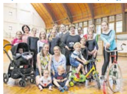
Baj KSE Kerékpár Szakosztály