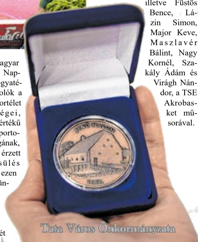
Tata Város Önkormányzata

jűk a Magyar Parasport Napját. A fogyatékos sportolók a hazai sportélet büszkeségei, és teljes értékű tagjai a sportolók világának, az irántuk érzett megbecsülés pedig itt, ezen a tatai ünnepségen is érezhető. A rendezvényen két